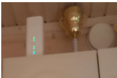
Nettiyhteys kylätalon keittiön kaapin päällä, (keskellä metsästysseuran palkinto ja oikealla venttiili).

Kylätalolla on nettiyhteys ja wifi-verkko, joten kokousten ja koulutusten järjestäminen onnistuu.